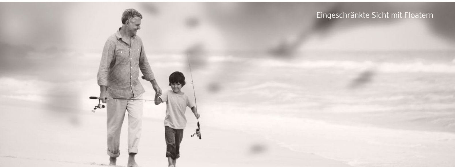
Eingeschränkte Sicht mit Floatern